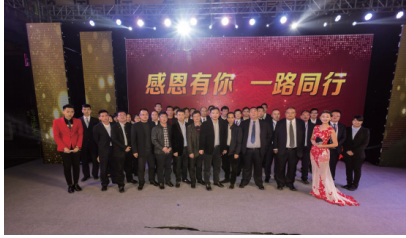
感谢有你·一路同行

1、祝贺南安市中国旅行社旅游公司被集团评为2015年先进集团。2015年是一个不平凡的一年，在整个大环境的影响下，旅游公司全体员工努力在传统旅游的基础上在积极寻找市场的突破口，取得了一定的成绩，希望再接再厉，2016年再创辉煌！ 2、第十二届中国（南安）国际水暖泵阀交易会盛大开幕。创会12年，规模行业第一。万商云集的交易会设9大展馆，共1270个标准展位，涵盖卫浴、水暖、阀门、消防、厨卫等产品，展出面积超过3万平，参展企业636家，规模创历年之最。旅游公司积极借用水暖交易会平台促销，单独展位，搭太空架、分发优惠券、扫微信送杯活动，前来参加活动的客人络绎不绝，取得很好的成效。